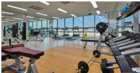
울산공장 피트니스 센터